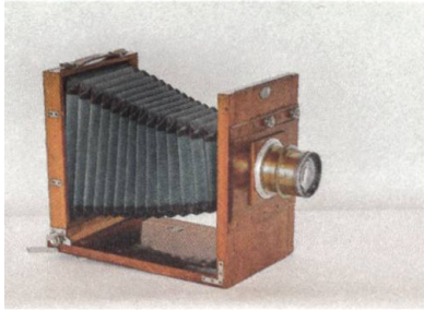
↑ Reisekamera der Firma Frey & Cie, um 1900. Die Fotoapparate wurden in der hauseigenen Kunsttischlerei hergestellt.