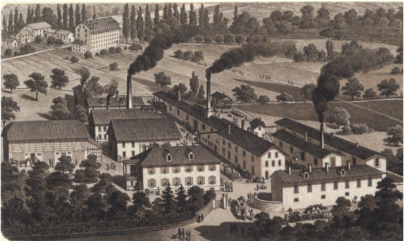
↑ Chemische Fabrik Frey in der Telli, Aarau, 1880. Im Hintergrund ersichtlich ist die von Friedrich Frey-Herosé errichtete Baumwollspinnerei und -weberei, die spätere Schokoladenfabrik.

Die Chemische Fabrik Frey produziert zu Beginn hauptsächlich Salzsäure, die für den Stoffdruck und fürs Färben benötigt wird. 6 Der Erfolg bleibt aber bescheiden: Aufgrund der starken Konkurrenz gehen die Preise für Säuren stark zurück. Bereits in der zweiten Hälfte des 19. Jahrhunderts muss die Fabrik ihre Angebotspalette umstellen und konzentriert sich bald auf die Herstellung von Chemikalien, die für die Fotografie benötigt werden, sowie Bedarfsartikel für Fotografen. Zudem bietet sie neu den Bau von Fotoapparaten an. 1910 wird der Betrieb sukzessive eingestellt, bis er 1929 ganz aufgegeben wird.