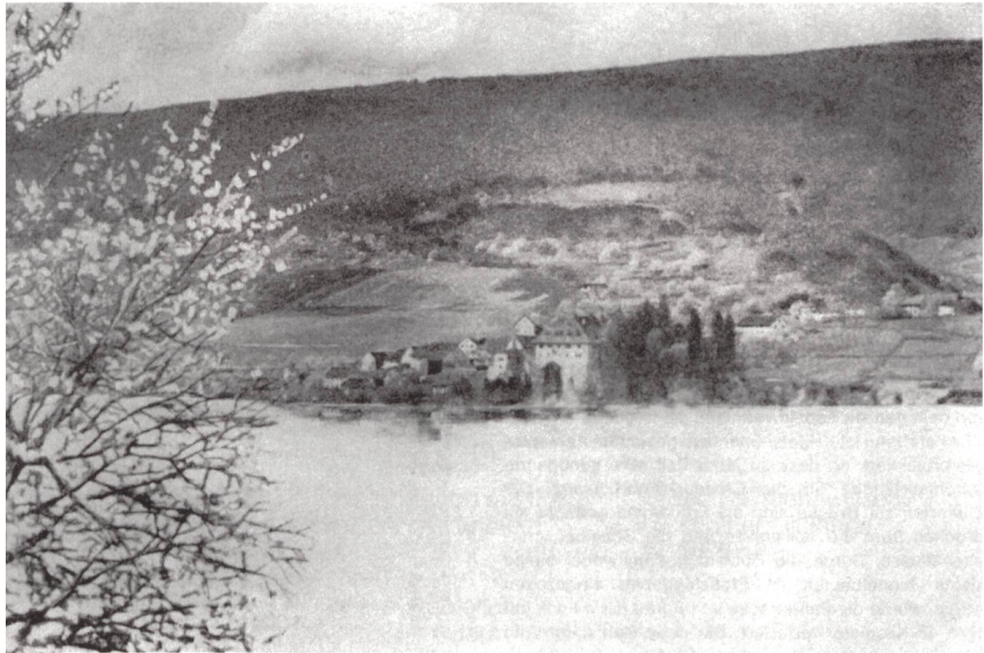
↑ Grafische Darstellung von Biberstein am Aaresee.