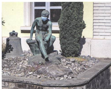
↑ Nicht im Kunstführer erwähnt: ein nackter Mann zu Corona-Zeiten vor der Glockengiesserei.

Um das Bild der weiblichen Kunst im öffentlichen Raum beleuchten zu können, braucht es zuerst einen Blick auf die dortige, selbstverständliche Anwesenheit von Männern. Im 19. Jahrhundert wurden in den bürgerlich geprägten europäischen Städten nach den Fürsten und Feldherren auch Gelehrte und Künstler in Marmor und Bronze verewigt. In Aarau hielten sie relativ spät Einzug. Als Erster erhielt 1879 Augustin Keller ein Denkmal, ein Schweizer Politiker aus dem Aargau; 1894 folgte der Politiker und Volksaufklärer Heinrich Zschokke als Zweiter. Zwischen 1902 und 1993 kam ein Dutzend weiterer Männer zu Ehren. Die Statuen, Reliefs und Büsten in Parks und Innenräumen verkörpern lokale Männer wie Friedrich Rudolf Zurlinden sowie schweizweit bekannte politische oder militärische Oberhäupter wie General Hans Herzog. Auch der berühmte Albert Einstein, der 1896 in Aarau die Matura erlangte, wurde verewigt.