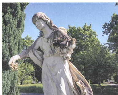
↑ Die Trost spendende Frauenfigur mit Rosen von Heinrich Waderé blickt zu den Kindergräbern.

Eine Wandmalerei im Spital zeigt eine Frau, die sich zu einem jungen, am Boden sitzenden Mann hinunterbückt und sich um seine Beschwerden kümmert: eine typisch weibliche Geste.