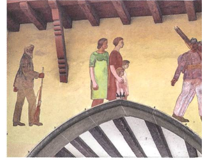
↑ Trauernde Frauen hinter strammen Soldaten, Ausschnitt aus der Wandmalerei von 1914 am Obertor.

Seit über 100 Jahren erinnert eine Wandmalerei am Obertor an die Mobilmachung im Ersten Weltkrieg. Stramme Soldaten ziehen aus der Stadt hinaus, hinter ihnen stehen in gebückter Haltung zwei Frauen mit zwei Mädchen, denen nichts anderes übrig bleibt, als dem Auszug traurig zuzusehen.