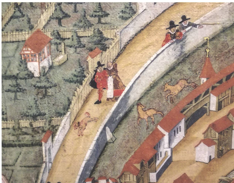
↑ Ein Ehepaar mit Hund spaziert am Hirschengraben entlang Richtung Laurenzentor. Detail aus der Stadtansicht von H.U. Fisch, 1612.

Nach der Gründung des Kantons Aargau schuf dieser Jungkanton schon bald eine eigene Hebammenschule, zu deren Händen mit dem 1805 in Aarau gedruckten Lehrbuch «Katechismus für die Hebammen des Kantons Aargau» ein wegweisendes Hilfsmittel entstand. Die Autorschaft desselben lag notabene bei einem Mann, dem Aarauer Chirurgen Heinrich Schmuziger (1776–1830).