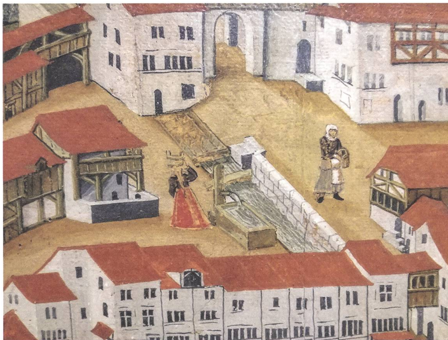
← Auch beim Brunnen zwischen den Toren holen Frauen Wasser. Detail aus der Stadtansicht von H.U. Fisch, 1612.

Ab dem 16. Jahrhundert, dank der immer dichter werdenden Quellenlage, werden Frauen auch als Mütter, Gotten und Ehefrauen greifbar. In erster Linie wirkten die Frauen in Haus und Hof. Weitere Erwerbszweige treten beispielsweise in Gerichtsunterlagen hervor, in denen manchmal nebenbei auch etwas über ihre Tätigkeiten als Mägde, Wäscherinnen, Näherinnen oder Köchinnen in Erfahrung zu bringen ist. Häufig werden die Frauen über ihre Gatten definiert: Sei es, dass sie als geachtete Frau Pfarrerin oder Frau Ratsherrin auftreten, sei es, dass sie in den Ämtern ihrer Männer im Hintergrund aktiv mitarbeiten. So wurde das Spital nicht nur vom «Spittelätti» allein unterhalten, sondern explizit auch von der «Spittelmutter». Sämtliche politischen Ämter und die grosse Mehrheit der städtischen Dienste waren Männern vorbehalten. Als Wächter, Boten, Zöllner, Bannwarte oder Totengräber kamen Frauen nicht infrage. Aber auch mit körperlich weniger anstrengenden Ämtern, wie zum Beispiel dem Hirtendienst oder der Brotqualitätskontrolle, der «Brot-Schau», wurden stets Männer betraut.