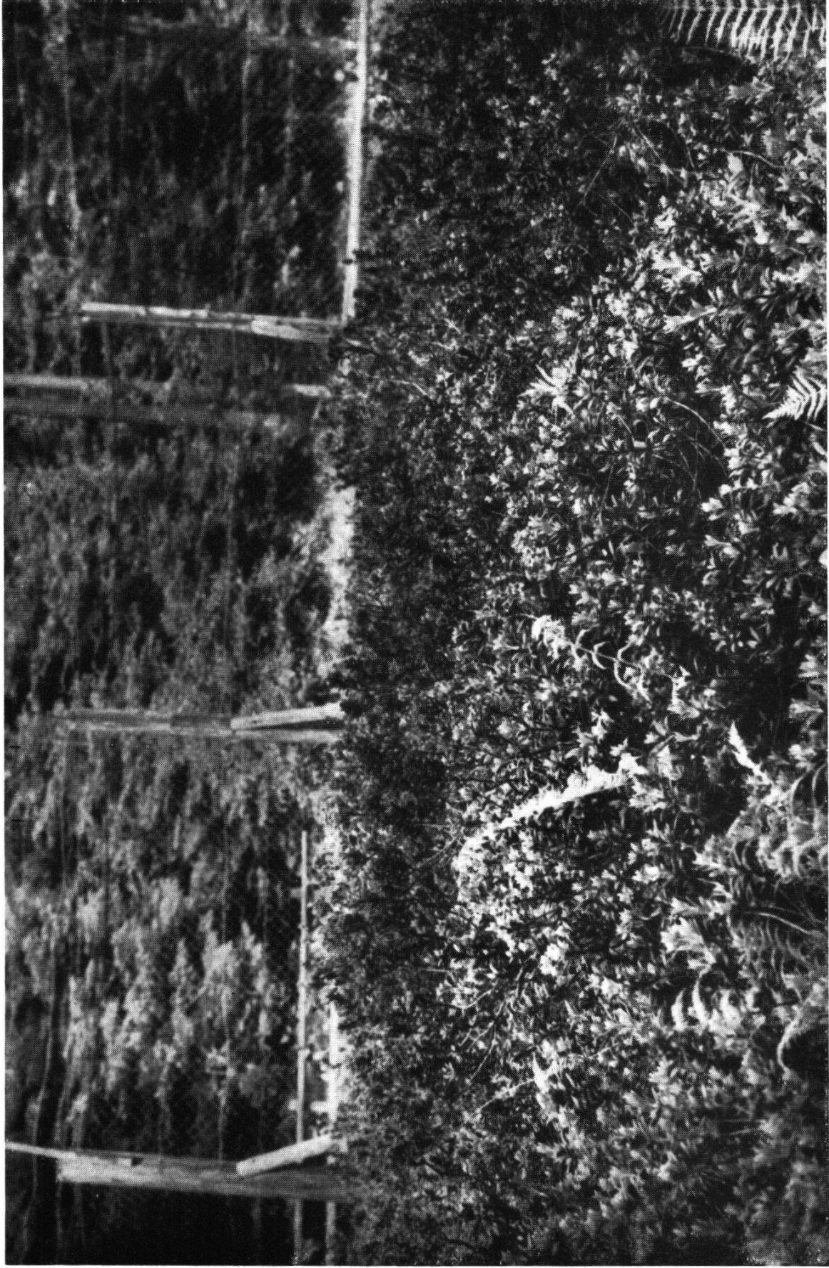
Phot. S. Schwere, 24.V.34.

Alpenrosenkolonie ( Rhododendron ferrugineum ) in Schneisingen.