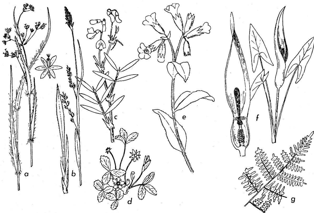
Abb. 3. Pflanzen aus dem Eichen-Hagebuchen-Wald

scheinbaren Blütchen; sie gibt unserer Gesellschaft ja den Namen (... luzuletosum ). Ferner sind hier noch anzufügen die Bergplatterbse ( Lathyrus montanus ) mit schmutzigroten Schmetterlingsblüten, der sparrige Adlerfarn ( Pteridium aquilinum ) und gelegentlich auch die Heidelbeere ( Vaccinium myrtillus ). Gemeinsam mit allen Laubwäldern erscheinen Goldnessel ( Lamium galeobdolon ), Vielblütiger Salomonssiegel ( Polygonatum multiflorum ), Waldveilchen und Teppiche des Waldmeisters, um nur einige aufzuzählen. Alle diese Arten schließen sich zu einer gutentwickelten Krautschicht zusammen, über welcher eine Strauchschicht wenig oder kaum in Erscheinung tritt. Neben Krautarten, welche hinsichtlich des Säuregehaltes des Bodens einen weiten Spielraum besitzen, deuten andere, empfindlichere Pflanzen, wie Heidelbeere, Bergplatterbse, auf eine leicht saure Bodenreaktion hin. Entsprechende Untersuchungen be-