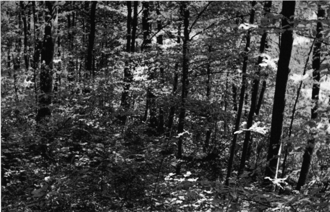
Abb. 7. Seggen-Buchen-Wald ( Cariceto-Fagetum ) von der Südseite des Frickerbergs. 10–12 Straucharten bilden eine reichentwickelte Strauchschicht. Auch die Krautschicht ist gut ausgebildet und vor allem durch verschiedene Arten des Waldvögeleins ausgezeichnet.