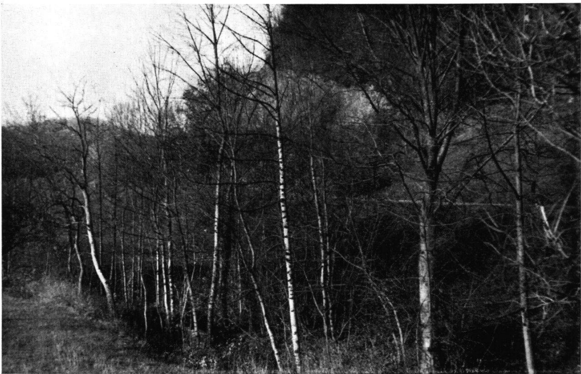
Abb. 8. Bacheschenwald bei der Schellenbrücke ob Küttigen. Längs des Bachlaufes bildet sich ein Waldsaum, an welchem Bergahorn (rechts) und Esche (links) beteiligt sind.