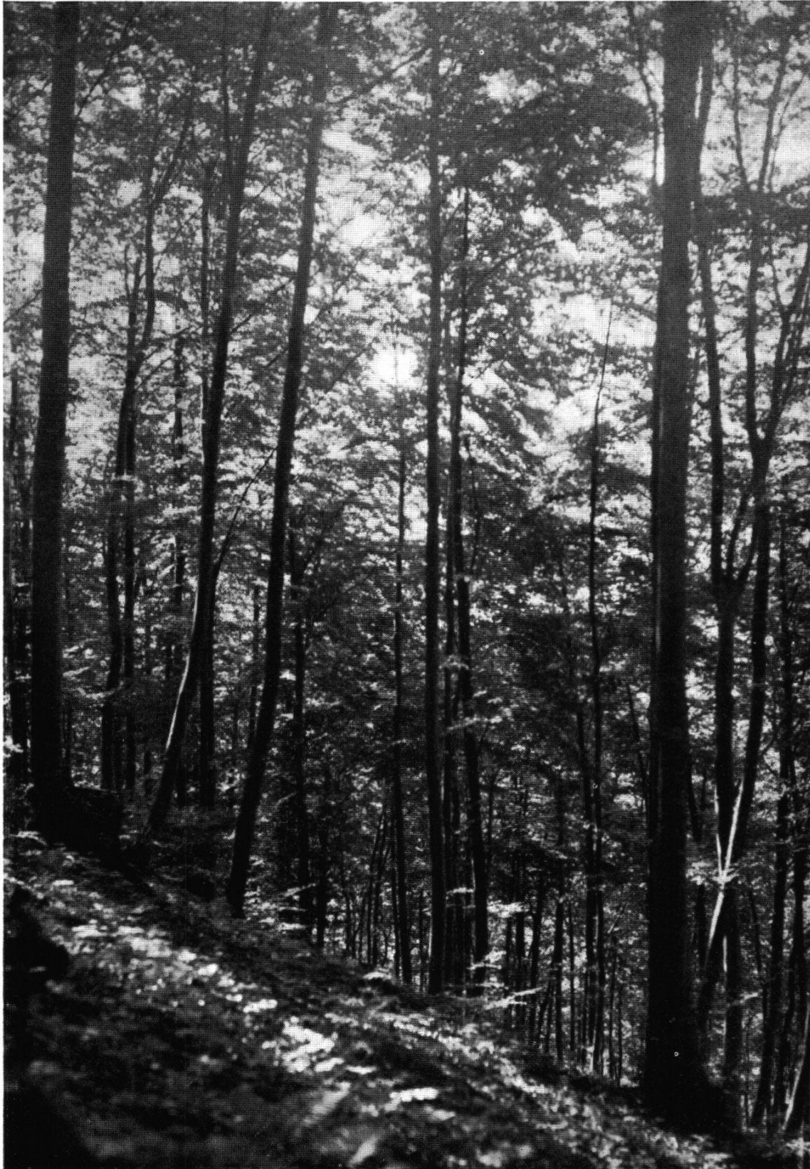
Abb. 6. Typischer Buchenwald ( Fagetum typicum ) auf der Nordseite des Herzbergs. Neben der Buche sind einzig noch Bergahorn und Esche eingestreut. Die Strauchschicht tritt nur schwach in Erscheinung, nur da und dort breitet sich Buchenjungwuchs aus.