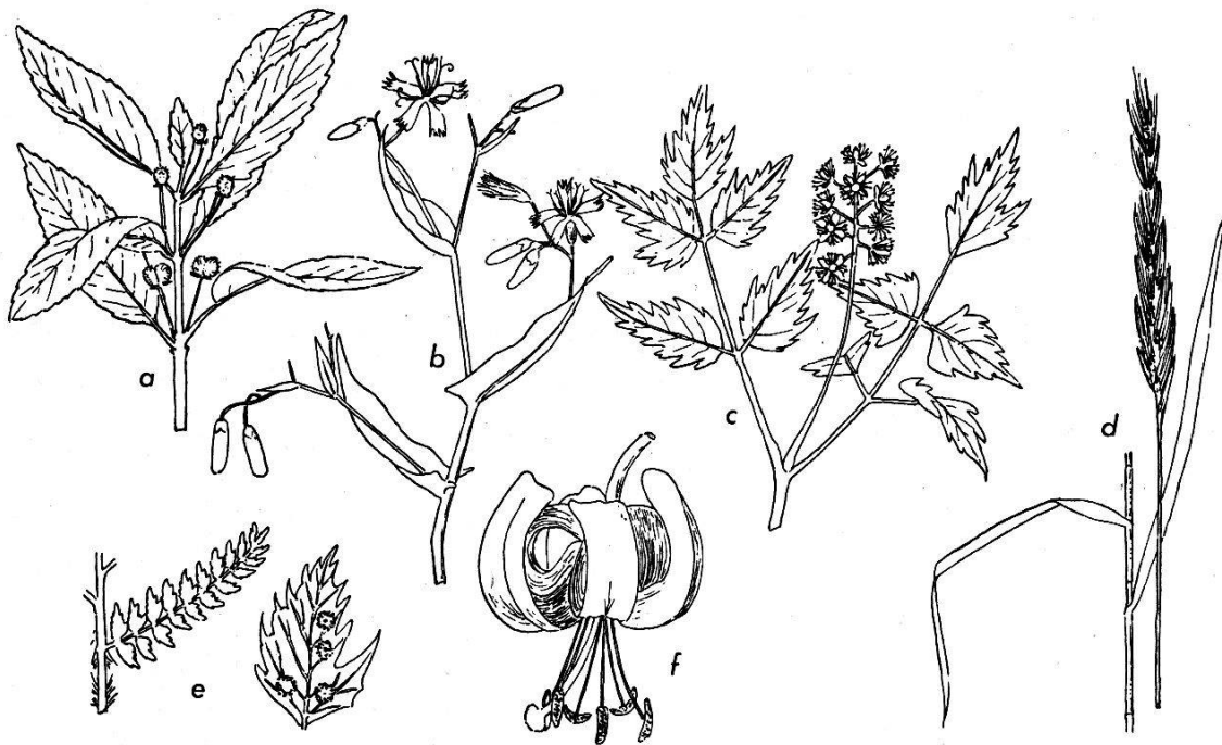
Abb. 5. Charakterpflanzen des Buchenwaldes

Er besiedelt bei uns vor allem die nach Norden gerichteten Hänge des Falten- und Tafeljuras, so als Beispiele Nordhang der Egg, Achenberg, Gisliflüh, Lägern, aber auch die Steilstufen von Kornberg (Abb. 2, S. 16), Frickerberg, Schynberg und Kaistenberg. Gerade an diesem letzteren Standort, an der Kunzhalde, steigt das Fagetum bis fast in die Rheinebene auf etwa 380 m herunter. In