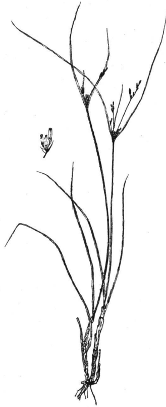
Abb. 2. Juncus tenuis Willd.