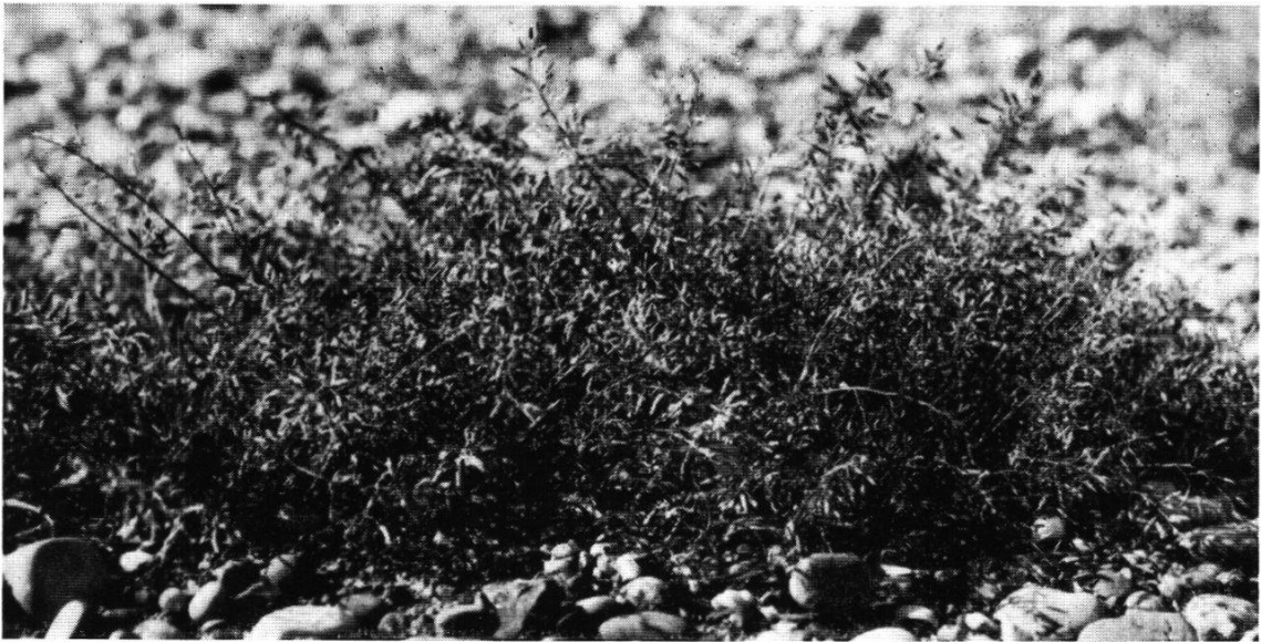
Abb. 4. Eragrostis poides P. B. im Schotter des Güterbahnhofs Aarau.