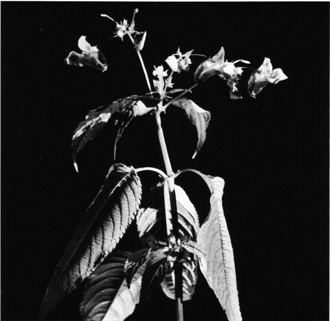
Abb. 5. Impatiens glandulifera ROYLE.