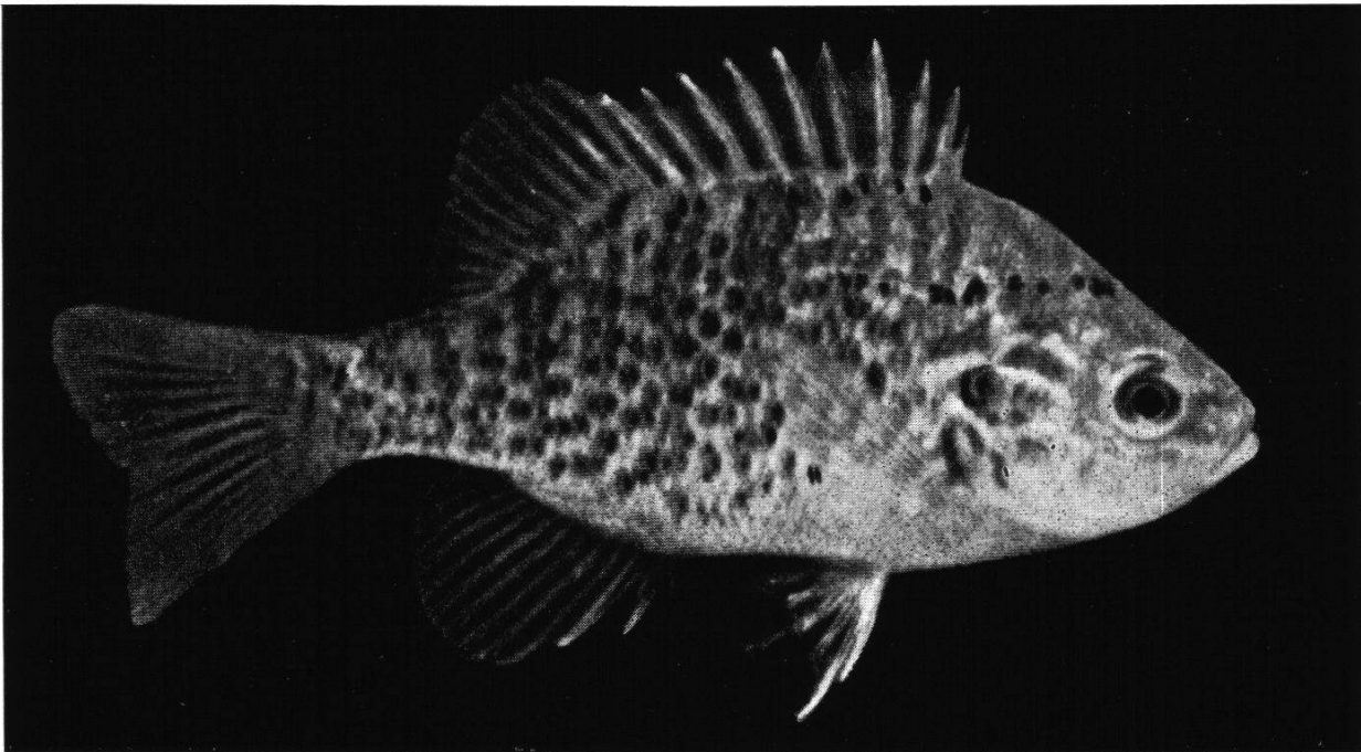
Abb. 2. Sonnenbarsch, in Südamerika heimisch, bei uns ursprünglich als Aquarienfisch gehalten, dann «verwildert», kommt in den letzten Jahren im Aargau immer häufiger vor.