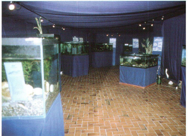
Abb. 7: Ausstellung von lebenden einheimischen Fischen im November 1995.

Als letztes erwähne ich die Publikationen im Aargauer Tagblatt. Bis zu meinem Rücktritt 1990 wurden es 175 Artikel über einzelne Objekte oder Gruppen unseres Museums, wobei der kurze Text stets mit einer Zeichnung versehen war. Die Separata dieser Texte sind die letzten Zeugen einer abgeschlossenen Aarauer Museumsepoche.