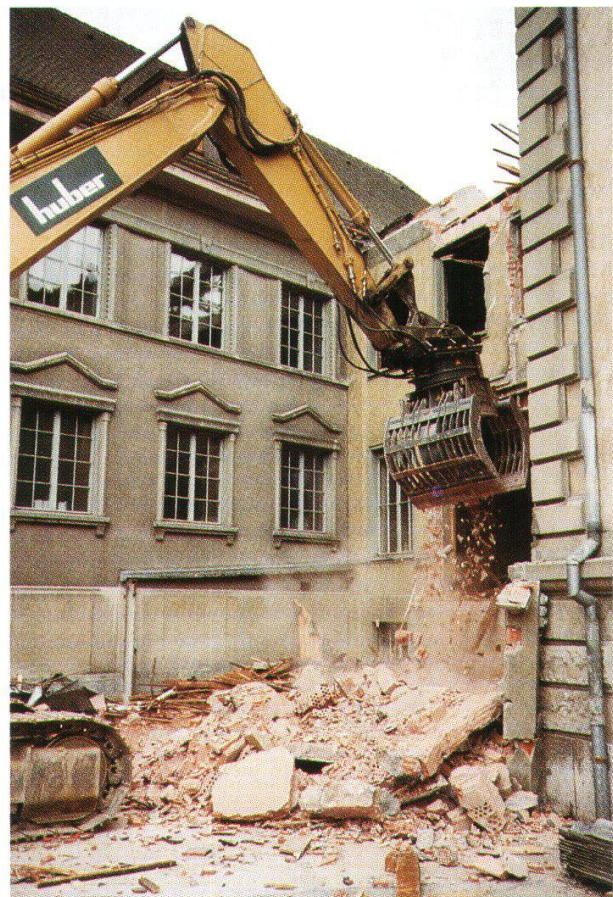
Abb. 2: Spatenstich des Naturamas am 1. September 1998. Unter den neugierigen Blicken vieler Zuschauer (u.a. Regierungsrat Wertli und Stadtammann Guignard) beginnt ein Bagger den Verbindungsbau zwischen Villa und Museum zu demolieren.