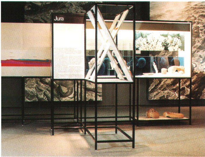
Abb. 5: Anfangs der 70er-Jahre wurde die Abteilung Geologie neu eingerichtet; hier ein Ausschnitt zum Thema Fossile Korallenriffe im Jura.

tungskörpern müssten vollständig erneuert werden, kam das einer Demontage der Tierkojen gleich. Wir entschlossen uns daher, die Lebensbilder in den Estrich zu zügeln, die ganze Sammlung aufzufrischen und teilweise