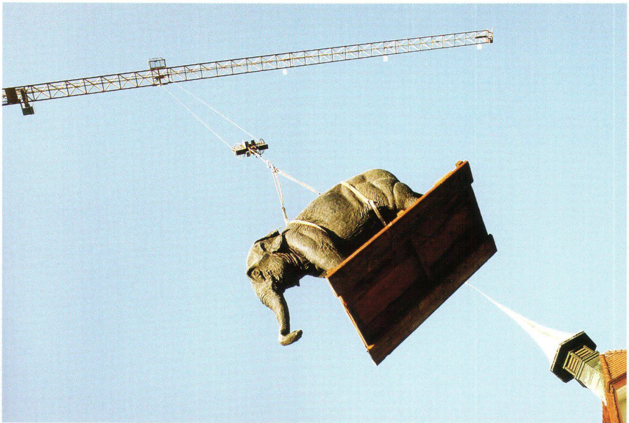
Abb. 1: Fliegender Elefant: Nach fast 70 Jahren im Aargauischen Naturmuseum wurde der Indische Elefant im November 1998 per Kran aus dem offenen Dach gehievt um eine neue Bleibe im Naturhistorischen Museum in Bern zu finden.