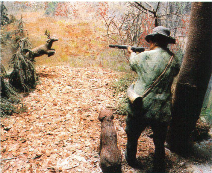
Abb. 3: Die kleinen, liebevoll gestalteten Dioramen in der Jagdabteilung waren immer eine besondere Attraktion für Kinder.

Während wir noch mit dem Einrichten der Knochen beschäftigt waren, trat der Aargauische Jagdschutzverein mit einer Anfrage an die Museumskommission heran. Die Gesellschaft hatte vor, im Jahre 1958 ihre Jahresversammlung in Aarau abzuhalten und wollte bei dieser Gelegenheit unser Museum besuchen. Deshalb die Frage, ob wir unsere Abteilung «Jagd», die seit der Museumseröffnung aus einigen Waffen und Trophäen bestand, erneuern könnten. Wir sagten zu und richteten die Schau entsprechend ein: Im Teil, der sich an die Öffentlichkeit richtete, warben wir für Verständnis dem Jäger gegenüber. Die