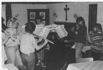
Impressionen aus dem Musiklager der Musikschule Frick im Schloss Schwandegg in Menzingen ZG.

In diesem Jahr wurde die Musikschule Frick zehnjährig. Die Jubiläumsveranstaltungen begannen mit einem Adventskonzert im Dezember 1988. Nach einem Südamerika-Konzert, an dem eine Kollekte über Fr. 9000,- für ein Entwicklungshilfeprojekt in Ecuador erbrachte, folgte ein Musiklehrerkonzert in drei Teilen, nämlich einem üblichen Konzert-