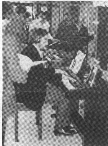
Elektronische Musikinstrumente sollen an Musikschulen kompetent angeboten werden. Unser Archivbild stammt von der VMS-Informationstagung in Lenzburg vom 12. Nov. 88 über elektronische Instrumente.

Elektronische Instrumente und deren Existenz sind eine Tatsache, die niemand aus der Welt schaffen kann – es ist jedoch unser aller Aufgabe, wenigstens nach sinnvollen Möglichkeiten des Einsatzes zu suchen. Der Anwender (lies: Schüler) darf nicht im Stich gelassen werden, indem ihm von kommerzieller Seite her unter dem Deckmantel «Musikschule» erbärmlichste Unterweisung in der Handhabung des gekauften Instrumentes geboten wird. Auch diesem Musikinteressierten ist die Möglichkeit zu zielgerichteter Musikerziehung zu bieten,