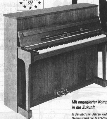
Piano 114 cm Europa Nußbaum Schwarz Mahagoni Weiss Eiche poliert satiniert