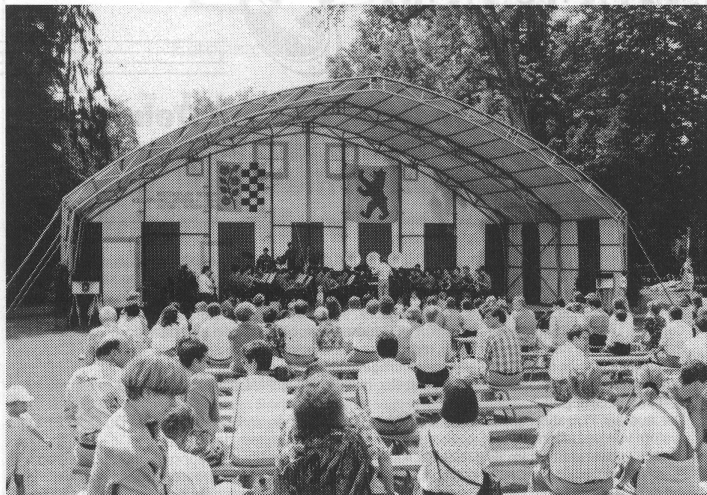
Das Bühnenzelt spendete den Musikanten Schatten und garantierte gleichzeitig für vorteilhafte akustische Bedingungen.

Höhepunkt der Veranstaltungen zum Jubiläum «25 Jahre Musikschule Cham»