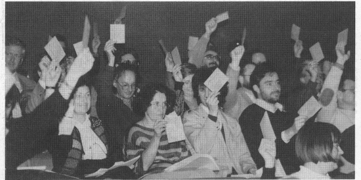
Das Tätigkeitsprogramm 1990/91 wird genehmigt.