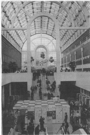
Die «Galleria», das Zentrum der Messe. Raum für Konzerte und Ausstellungen. Auch der Verband deutscher Musikschulen war hier mit einem Informationsstand vertreten.

Der neue professionelle Light&Sound-Sektor erweiterte das ohnehin schon reichhaltige Angebot.