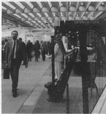
Sorgfältig, oftmals geradezu mit Stil, präsentierten sich die traditionellen Instrumentenhersteller und Musikverlage.

Neben Tonstudio-Einrichtungen konnte man alle Arten von Laserlichttechnik über sich ergehen lassen. Im Zentrum des Publikumsinteresses stand wiederum die Elektronik und hier vor allem der stark erweiterte Ausstellungsbereich Musikcomputer. In einem eigenen Piano-Salon präsentierten gegen 100 Hersteller traditionelle Tasteninstrumente und deren Zubehör. Steinway zeigte seinen speziell kreierten 500 000sten Flügel, und Bösendorfer hatte mit dem exklusiv entworfenen «Hollein-Flügel», welcher als teuerster Flügel (rund 160 000 Franken) in limitierter Anzahl sogar käuflich ist, einen Publikums-magneten. Neben dem Trend zu Designexklusivitäten und Spezialmodellen ist eine gegenläufige Strömung auszumachen, hin zu äusserlich sparsam gestalteten Flügeln, die gegenüber den normalen Modellen deutlich billiger sind. Insgesamt zeichneten sich die Hersteller traditioneller Instrumente vor allem durch Detail- und Modellpflege aus. Im Gegensatz zum Gedränge auf den drei Etagen der Halle 9, welche ganz den elektronischen Instrumenten samt Zubehör reserviert war, ging es in den beiden übrigen Hallen mit den akustischen Instrumenten und den Musikverlagen bedeutend ruhiger her und zu. Trotzdem wurde aber bemerkt, dass sich die traditionellen Musikinstru-