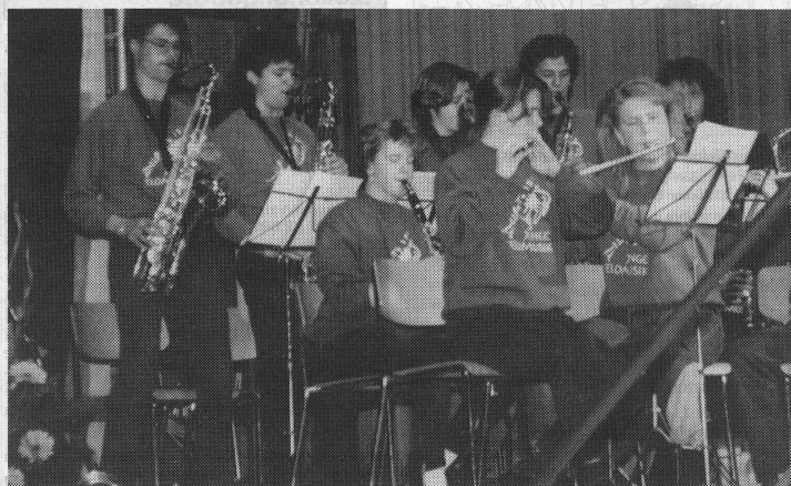
Blasmusik ist in Willisau Trumpf: die Junge Feldmusik Willisau. Das Instrumentalspiel lernen die jungen Bläser in der Musikschule.