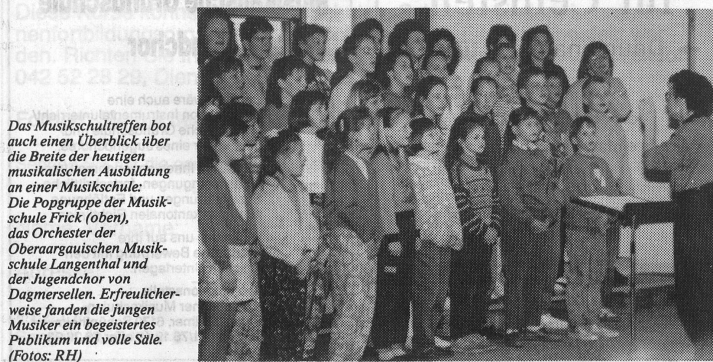
Das Musikschultreffen bot auch einen Überblick über die Breite der heutigen musikalischen Ausbildung an einer Musikschule: Die Popgruppe der Musikschule Frick (oben), das Orchester der Oberaargauischen Musikschule Langenthal und der Jugendchor von Dagmersellen. Erfreulicherweise fanden die jungen Musiker ein begeistertes Publikum und volle Säle.