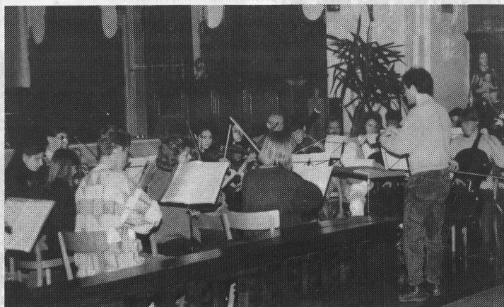
Das Orchester der Allg. Musikschule des Konservatoriums Bern.

Das Musikschultreffen in Willisau hat nicht nur Begegnungen zwischen jungen Menschen aus der ganzen Schweiz und aus allen Landesteilen ermöglicht, es hat auch eindrücklich aufgezeigt, dass heute der musikalischen und damit auch der musischen und letztlich der kulturellen Erziehung in unserem Land ein viel grösseres Gewicht zukommt als noch vor wenigen Jahren. Dass das breite Angebot der Musikschulen für die Gemeinden und Kantone erhebliche finanzielle Folgen hat und den Schulverantwortlichen dementsprechend Sorgen bereitet, versteht sich. Die jungen Musikerinnen und Musiker, die in Willisau aufgetreten sind, haben allerdings bewiesen, dass dieses Geld richtig und sinnvoll investiert ist – als Anlage nicht bloss in eine Nebensache, sondern in eine Notwendigkeit.