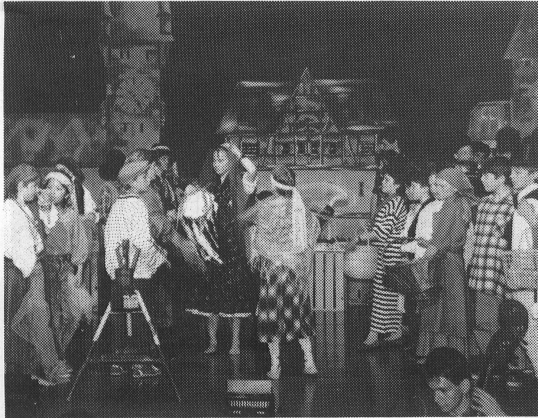
«Das Geheimnis um den Wagen», ein Schüler-Musical mit gesellschaftspolitischem Inhalt.