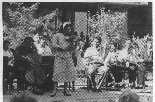
Das ungarische Jugendensemble «Raikó Kapelle» aus Budapest.

avons gardé le contact avec nos hôtes et nous espérons bien les revoir. Nous avons tous préféré loger dans des familles plutôt que de loger dans un centre. Nous n'avons pas eu de problèmes de langue, le contact était si naturel!