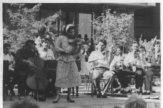
Das ungarische Jugendensemble «Raikó Kapelle» aus Budapest.

avons gardé le contact avec nos hôtes et nous espérons bien les revoir. Nous avons tous préféré loger dans des familles plutôt que de loger dans un centre. Nous n'avons pas eu de problèmes de langue, le contact était si naturel!