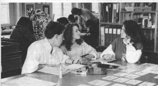
L'école d'aujourd'hui pour celle de demain: travailler de manière autonome, faculté de travailler en groupe, sentiment de bien-être en classe.

Vous pouvez obtenir le manifeste «Aujourd'hui comment penser l'école pour la Suisse de demain» auprès du bureau du Conseil Suisse de la Musique, Bahnhofstr. 78, 5000 Aarau, tél. 064/22 94 23.