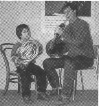
Eine aufrechte Spielhaltung und ein guter Kontakt der Füsse mit dem Boden sind wichtig.

Das Kinderhorn ist ein einfaches, kleines B-Horn, einmal mehr gewickelt als das grössere Standardinstrument, aber mit identischer Konik,