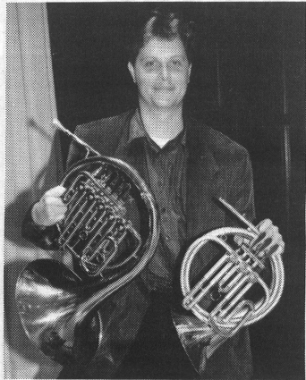
Trotz der Grössendifferenz zum normalen Horn klingt das Kinderhorn in der selben Stimmlage und Tonart, da es eine zusätzliche Wicklung aufweist.

Ein Musikinstrument ist für Kinder im Alter von sechs bis sieben Jahren nicht in erster Linie ein Mittel zum Zweck des Musikmachens, sondern vielmehr ein Spielfreund und Partner. Sie wollen deshalb nicht bloss auf, nein, auch mit dem Instrument spielen. Diesem Umstand muss bei jedem frühen Einstieg in den Instrumentalunterricht Rechnung getragen werden.