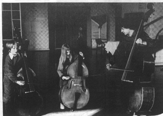
Dank Kontrabässen in den Grössen 1/8, 1/4, und 1/2 ist es möglich, wie bei den übrigen Streichinstrumenten schon früh mit dem Unterricht zu beginnen.