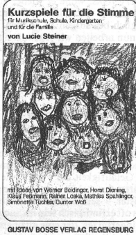
GUSTAV BOSSE VERLAG REGENSBURG

Kurzspiele für die Stimme Sing-mit-Cassette Buch und Cassette Buch BE 1293 sFr 31,20 BE 1293 01 sFr 28,40 BE 1293 02 sFr 54,90 (Preisänderungen vorbehalten)