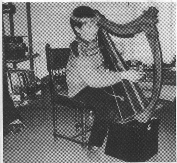
Die keltische Harfe eignet sich besonders gut auch für Kinder.

Gemäss der keltischen Tradition wurde das Repertoire der Harfe auf oralem Wege weitergegeben. Diese Tendenz hat sich bis heute in den bereits genannten Ländern erhalten. In Irland war es sogar zeitweise verboten, Harfe zu spielen. Die Machthaber wollten die keltische Tradition unterbinden und erlaubten deshalb nur Blinden, dieses Instrument zu spielen. Diese aber geben ihr Können mündlich trotzdem weiter. Erst in neuerer Zeit haben keltische Harfenisten begonnen, ihre Musik auch aufzuschreiben.