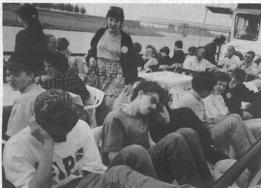
Entspannte Stunden: die Schifffahrt auf der Maas.

Barbara: Die Ausflüge in Holland waren toll! Das malerische Städtchen Heusden mit den vielen kleinen Geschäften und Cafés war entzückend. Kameradschaft und fröhliches Beisammensein im Orchester waren optimal.