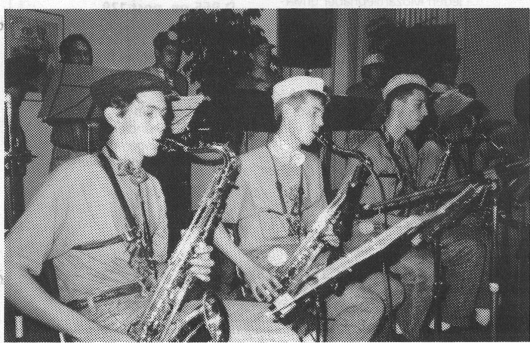
Angeregt durch den flotten Sound steigt die Stimmung immer höher.

Auf den Nebenbühnen läuft das Programm weiter ab, ähnlich wie am Vortag. Genau nach dem Schluss des letzten Ensembles bricht ein gewaltiger Gewitterregen los. Mehr oder weniger trocken gelangen wir zurück ins Philips-Stadion. Hier spielt