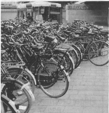
Für die Distanz zwischen Gastfamilie und Konzert/Probenort bot sich auch für die jugendlichen Musikanten das Velo als Verkehrsmittel an.