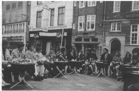
Treffpunkt auf dem Stadtbummel in Eindhoven. Nach und nach erweiterte sich die Tischrunde.

Stefanie: Ich habe in diesen sechs Tagen ausserordentlich liebenswerte Gasteltern kennengelernt, die sich nicht nur für mich, sondern auch für alles rund um uns herum interessierten und begeisterten. Ohne sie und die gute Organisation hätten wir es