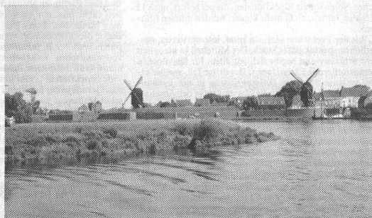
«Besonders beeindruckt hat mich die Schifffahrt auf der Maas, wo wir bei schönstem Sonnenschein auch einmal die holländische Landschaft näher kennenlernen konnten.»