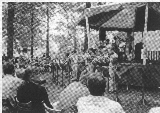
Workshop im Stadtpark von Eindhoven. Bläser aus der Schweiz spielen zusammen mit einer holländischen Rhythmusgruppe.

das Festival-Symphonie-Orchester sein Galakonzert bei strömendem Regen. Trotz sturmähnlicher Wetterlage gibt der Festivalchor noch zwei seiner einstudierten Werke zum besten. Ein Grossteil des Chorklages wird leider durch das Prasseln des Regens übertönt.