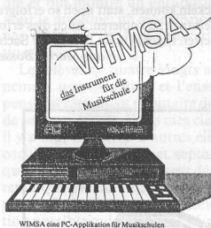
WIMSA eine PC-Applikation für Musikschulen