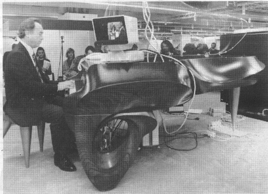
Design particulier pour un piano à queue Yamaha. Designer-Studie für einen Flügel von Yamaha.

Cette année, et ce fut un record mondial, plus de 500 pianos de toutes marques rivalisaient d'originalité et d'élégance. Nous avons ainsi pu faire connaissance d'instruments venus des pays de l'Est dont la facture nous a parfois séduit. Certes, l'Asie reste très présente et offre des produits de très bonne tenue également. Steinway, qui occupait une place stratégique au sein de l'exposition, n'avait jugé bon de ne déplacer qu'un seul instrument. Un geste bien arrogant! Notons également la combinaison de l'électronique aux instruments traditionnels qui permet de transcrire immédiatement sur partition