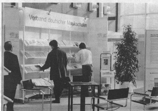
Dans la «Galleria», les écoles de musique allemandes présentent leurs activités. In der «Galleria» informierte der VdM über die Musikschularbeit in Deutschland.

Animato berichtet über das Geschehen in und um Musikschulen. Damit wir möglichst umfassend orientieren können, bitten wir unsere Leser um ihre aktive Mithilfe. Wir sind interessiert an Hinweisen und Mitteilungen aller Art sowie auch an Vorschlägen für musikpädagogische Artikel.