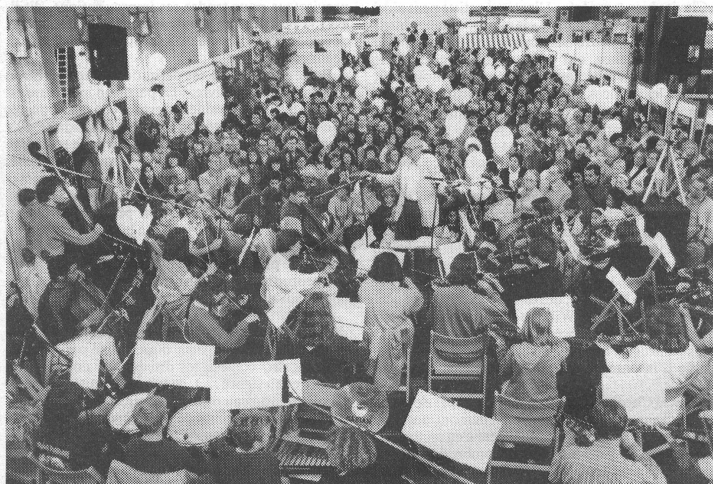
Wegen schlechten Wetters spielte die Jugendmusikschule Zürich ihr Open-Air-Konzert zum Abschluss des Schuljahres nicht im neu hergerichteten Parkareal «Platzspitz», sondern in der Halle des Zürcher Hauptbahnhofes. Die rund 180 Jugendlichen musizierten während fast dreier Stunden mit Enthusiasmus und grossem Erfolg. Die überaus zahlreiche Zuhörerschaft setzte sich vor allem aus Eltern und Geschwistern der jugendlichen Musikanten sowie zufällig anwesenden Passanten und Reisenden zusammen. (Ausführlicher Bericht auf Seite 11.)