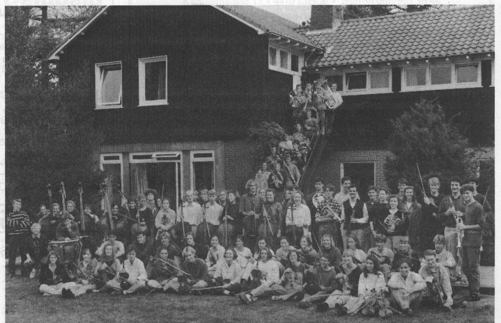
Das Holländische Jugendorchester vor der Jugendherberge in Aberdeen, wo das Orchester dreimal pro Jahr für Proben zusammenkommt.

Das nun in dritter Version vorliegende Opernprojekt «D'Horchhäx» - ein Gemeinschafts-Vorhaben der Allgemeinen Musikschule des Konservatoriums Zürich, der Jugendmusikschule der Stadt Zürich, der Sozialen Musikschule Zürich und dem Opernhaus Zürich - überzeugt nach dem Urteil der Stiftung «Kind und Musik» sowohl musikalisch als auch konzeptionell. Musik Hug wird nun als Veranstalter in Kooperation mit den beteiligten Institutionen die Kinderoper «D'Horchhäx» im Juni 1994 in Zürich zur Aufführung bringen. Weitere Konzerte in anderen Städten - voraussichtlich Basel, St. Gallen, Luzern, Lausanne - sind ebenfalls geplant.