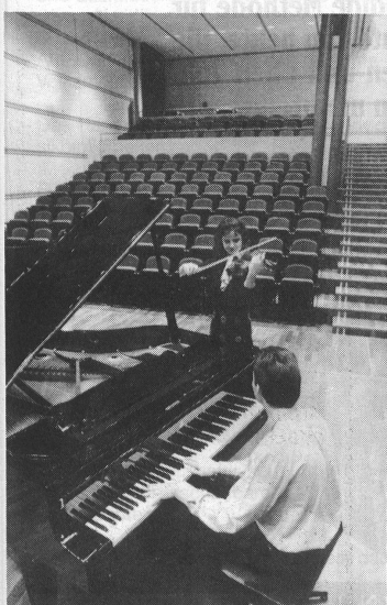
La grande salle du Conservatoire. L'ultime répétition avant le concert, quand enfin le travail portera ses fruits.

Je dois dire que ma rencontre avec la musique s'est faite essentiellement par le chant. J'ai évidemment travaillé à ce moment-là le piano pour pouvoir lire et accompagner les partitions, ainsi que pour pouvoir diriger. Ensuite, je me suis lancé dans la direction chorale et instrumentale à St-Etienne de Moudon afin d'animer ce lieu. Je pensais que la pratique musicale active d'une région lui est plus profitable que la venue d'orchestres de renom ne sollicitant aucune participation directe. Quand les gens peuvent interpréter des œuvres comme le Requiem de Mozart, de Schumann, de Fauré ou des Cantates de Bach accompagnés par l'Orchestre de Chambre de Lausanne, ou l'Orchestre de Bienne, ces activités-là sont extrêmement profitables. Né à Vevey, j'ai eu beaucoup de plaisir à retrouver l'église St Martin et à y diriger.