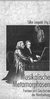
Musikalische Metamorphosen Formen und Geschichte der Bearbeitung

Ein echtes Lehrbuch und unentbehrliches Handbuch für jeden Kirchenmusiker, Instrumentalisten, Musikwissenschaftler und Liebhaber Alter Musik.