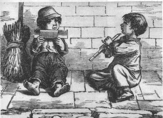
Abbildung aus dem «Zürcher Kalender» von 1856.