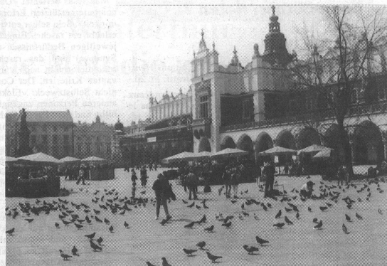
Marktplatz mit Tuchhallen – Krakau, nicht Venedig!