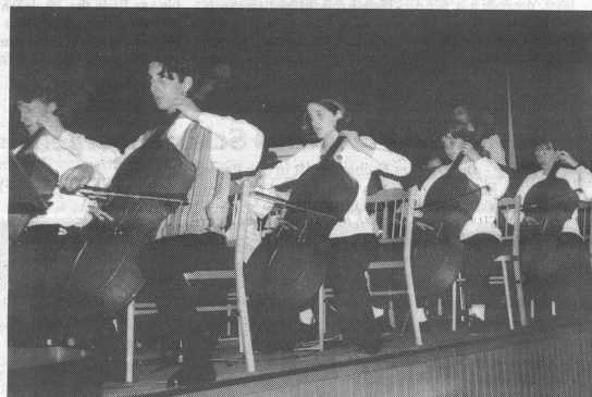
JOS-Konzert in Krakau – pars pro toto.