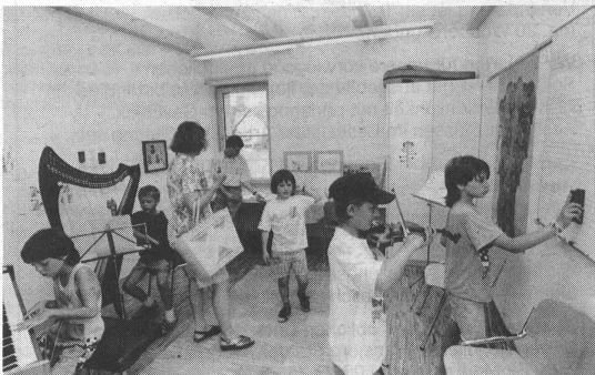
Offene Türen zur Musik.

Anlässlich der Schulhausweihe vom 1./2. Juli 1995 hatte auch die Jugendmusikschule ihre