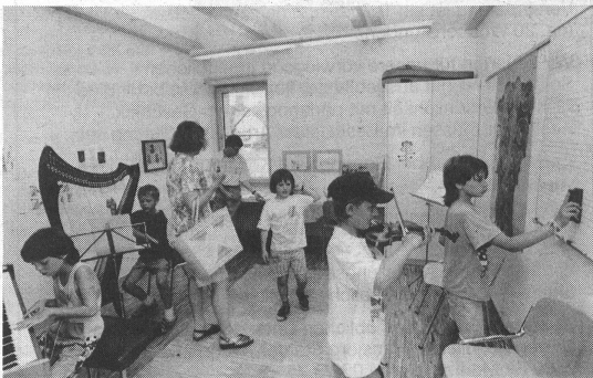
Offene Türen zur Musik.

Anlässlich der Schulhausweihe vom 1./2. Juli 1995 hatte auch die Jugendmusikschule ihre