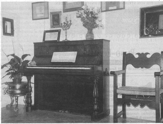
«Bitte nicht berühren»: Das mallorquinische Klavier, das Chopin den «Pleyel» ersetzen musste – heute in Valdemossa eine unantastbare «Reliquie».

Der Mietwagen des Landes ist die «tartana», eine Art Kremser ohne jede Federung, von einem Pferd oder Maultier gezogen. Der Kutscher singt die ganze Zeit hindurch und unterbricht nur, um gelassen die grässlichsten Flüche auszustossen, wenn sein Pferd zögert,