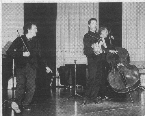
Ob Madrigal, Chanson oder Jazz: das Trio AVODAH begeistert mit seiner sprühenden Musikalität. Madrigale, chanson ou jazz, le Trio AVODAH impressionne par sa musicalité.