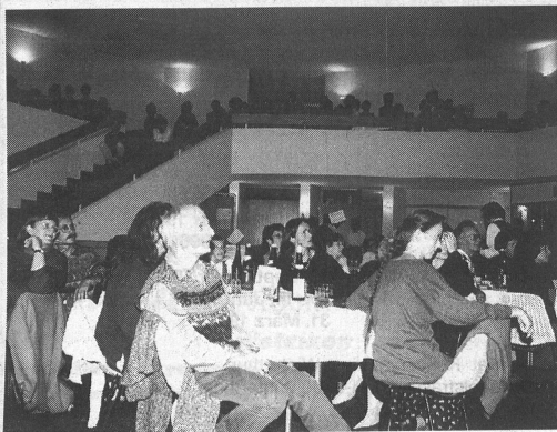
Geselliges Zusammensein mit artistischen Einlagen: am Kongressfest herrscht eine lockere Stimmung. Une agréable compagnie avec un côté artistique: l'ambiance de la Fête du congrès.