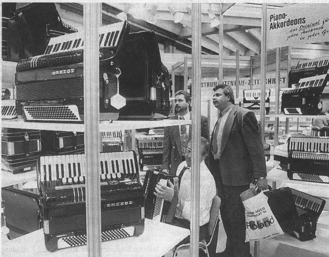
Ganz nach Belieben: einfach nur bestaunen, vorführen lassen oder selber ausprobieren.