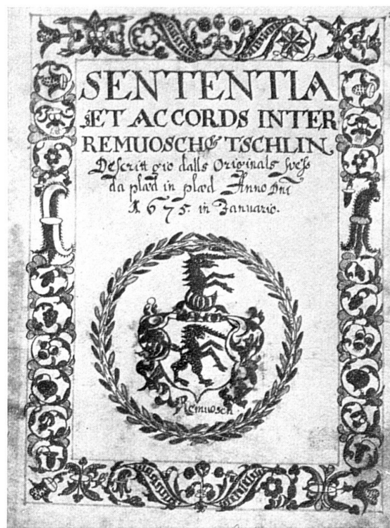
Pag. 561, las medemmas coluors. L'unicorn, voppa da Ramosch, ais fat cun tinta cotschna, l'ornamaint dal s-chüd in cotschen e nair, il cranz intuorn in cotschen e verd,