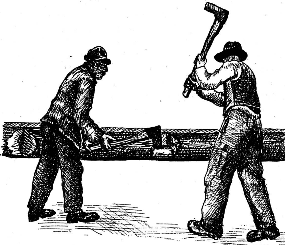
Dus taglialennas dattan crena culla sigir aulta, Rueun (desegn: Luis Maissen)