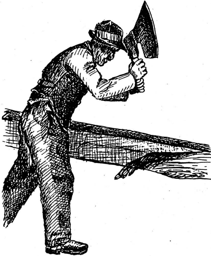
In tagliaenna dat culla sigir lada, Rueun (desegn: Luis Maissen).

stuein nus mo persecuitar las lutgas davart il marcau da Cuera encunter ils cussegls grischuns per il liber traffic e commerci. A Cuera existeva dapi 1465 ina uniun mistergnera. La constituziun helvetica de 1798 vul dismetter tut la tradiziun, e pretga il liber traffic e commerci per l'entira Svizzeria. A Cuera resistan las uniuns vinavon aunc varga 50 onns encunter tutta influenza liberalisonta. Mo la fin finala declaran las regenzas la libertad absoluta de mistregn, trafic e commerci. 1850 vegn la davosa emprova da vart las organisaziuns mistergneras fatga de puspei respectar las instituziuns veglias, denton senza success! Oz, suenter 90 onns, emprovan ins aunc adina de puspei dar normas al mistregn. Era il complet liberalissem ha buca purtau il salit perpeten. Ins vesa ch'igl ei prudent de schar enqual crap dil vegl baghetg per construir il niev.