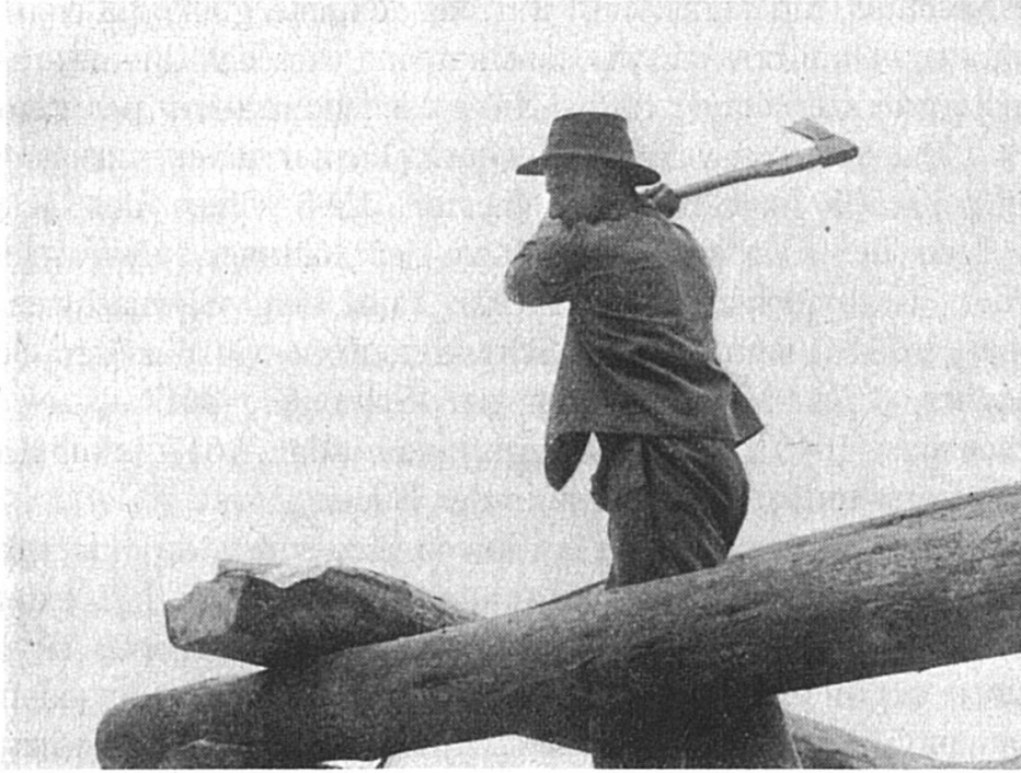
Far clavau. In pur-lennari fa giu vacca al pardaun (emprem lenn dil trer-tetg). Cuolms de Breil.