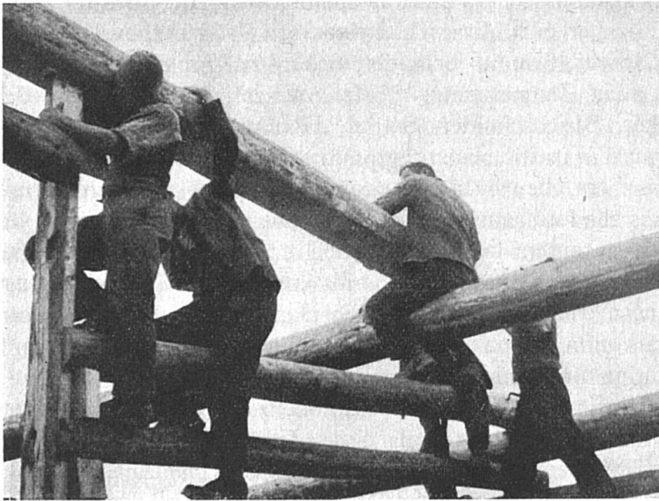
Plirs purs e meisters sfunsan la greva sutga-furada el peli della plema. Cuolms de Breil.