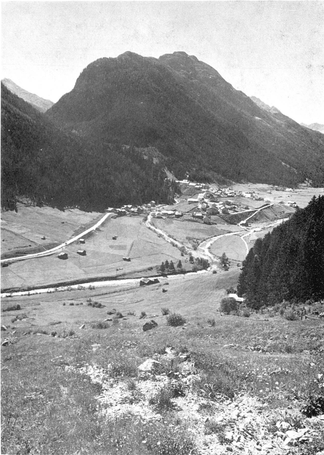
Il cumün dad Ischla cull'entrada da la Val Fenga (a man schvester) e vista vers l'ot Paznaun (a dretta)