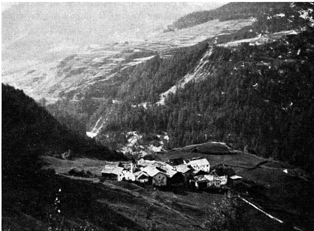
1. Vista vers Sur En

Ils 16 october 1971, ün grandius di d'utuon, sun eu statta persunalmaing a Sur En a far las fotografias per mia lavur;