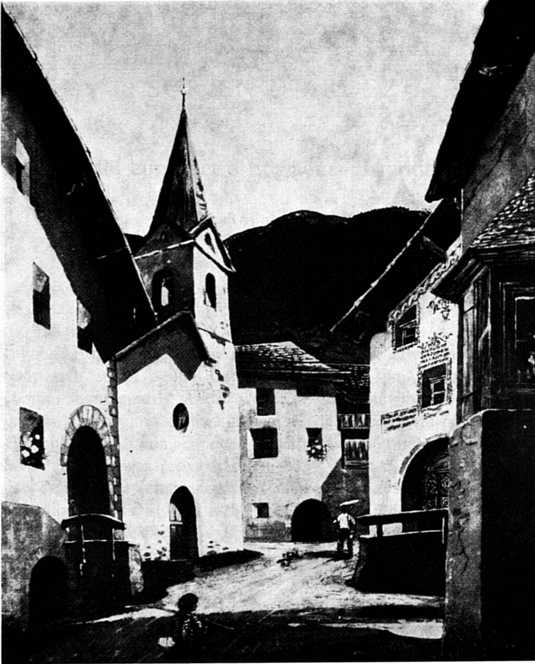
Sur En d'Ardez