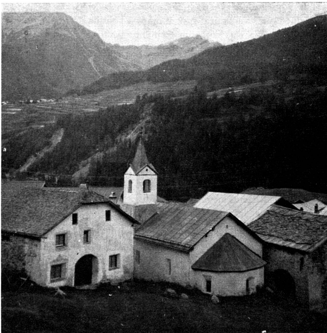
2. Baselgia da Sur En

Erwin Poeschel, il grond e baincuntschaint perscrutadur d'istorgia d'art, descriva la baselgia da Sur En in sias ouvras 11 ed eu prouv uossa da laschar seguir seis text in libra traducziun: