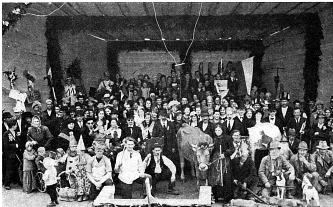
Fiasta da cant 1936: Act final dil til dils indigens sin tribuna

vid las meas vegnev'ei fatg grondamein rueida, e las producziuns libras sesperdevan ella canera da fiasta. Tuttina fuva quei stau in eveniment da cant impressiunont cun 26 uniuns participontas ord l'entira Surselva.