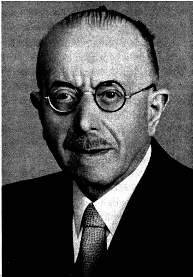
Prefect Gieri Giusep Montalta 1872 – 1964

veva la vischnaunca urbarisau in grond toc pastira e partiu quella en sorts u pendas e schau ina da quellas a mintga casada per diever. Quella radunonza ha declarau tut quellas pendas-Bual sco fondao da scola. Il tscheins annual da quels beins vegn duvraus per salarisar il scolast . . . la rendita annuala vegn schaziada sin 42. – flurins. Quei che manca vegn