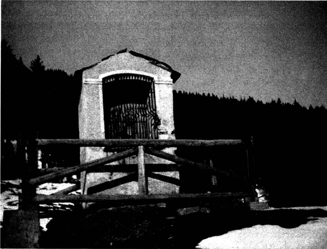
Caplut da S. Roc cun il bi uaul digl Escher

Via da Cuschnaus. La via veglia da Cumbel a Morissen menava suenter la val da Mulin enasi agradsi tochen el vitg. Cheu stuevan cavals e bos suar da runar siado lenna, sablun e material da baghiar e beinenqual pedunz cun greva purtadira fageva quella via dil Calvari. –