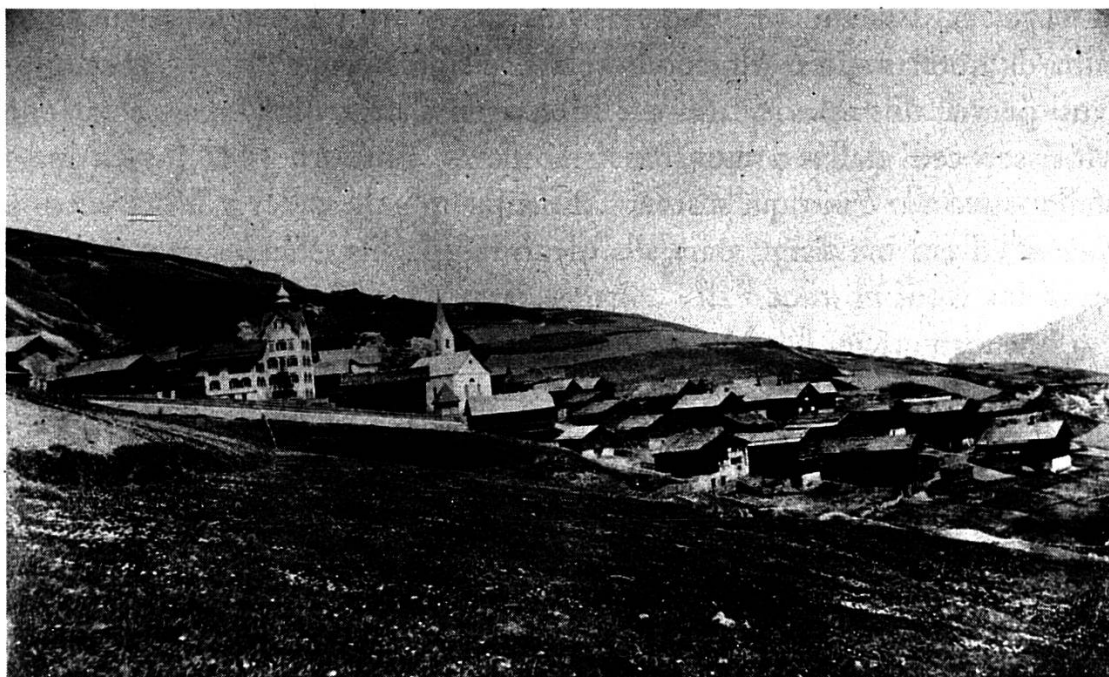
Morissen viers nord-ost