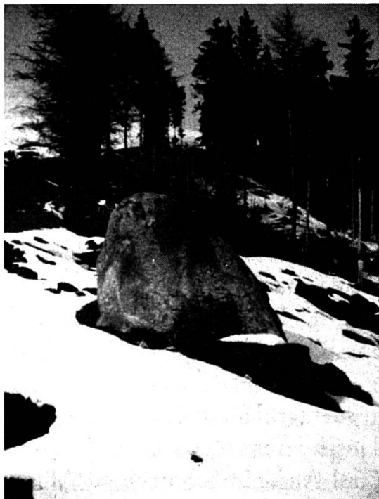
Il crap digl Escher sper via a S. Carli cun igl uaul digl Escher

Realp UR, ina tiarza a Münster/Geschinen VS ed ina tiarza per ina plontaziun a S. Carli/Morissen. Cun agid dalla Confederaziun han ins plontau cheu 208 000 plontinas, 70% pegns, 16% larischs e 14% schiembra egl importo da 17 250.– fr. La Confederaziun ha pagau 75%. Las lavurs, sin ina altezia da 1600–1750 sur mar, ein succedidas denter 1874 e 1889. Oz eis ei in bi uaul.