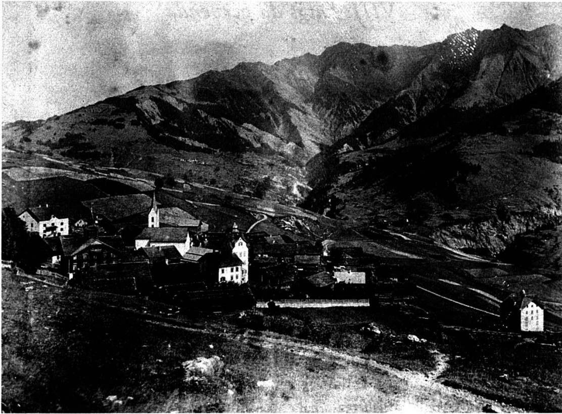
Morissen viers damaun cun Riein

quei diesch bazs per curtauna. Il contract ei approbaus dalla curia ils 9 da matg 1818. 7