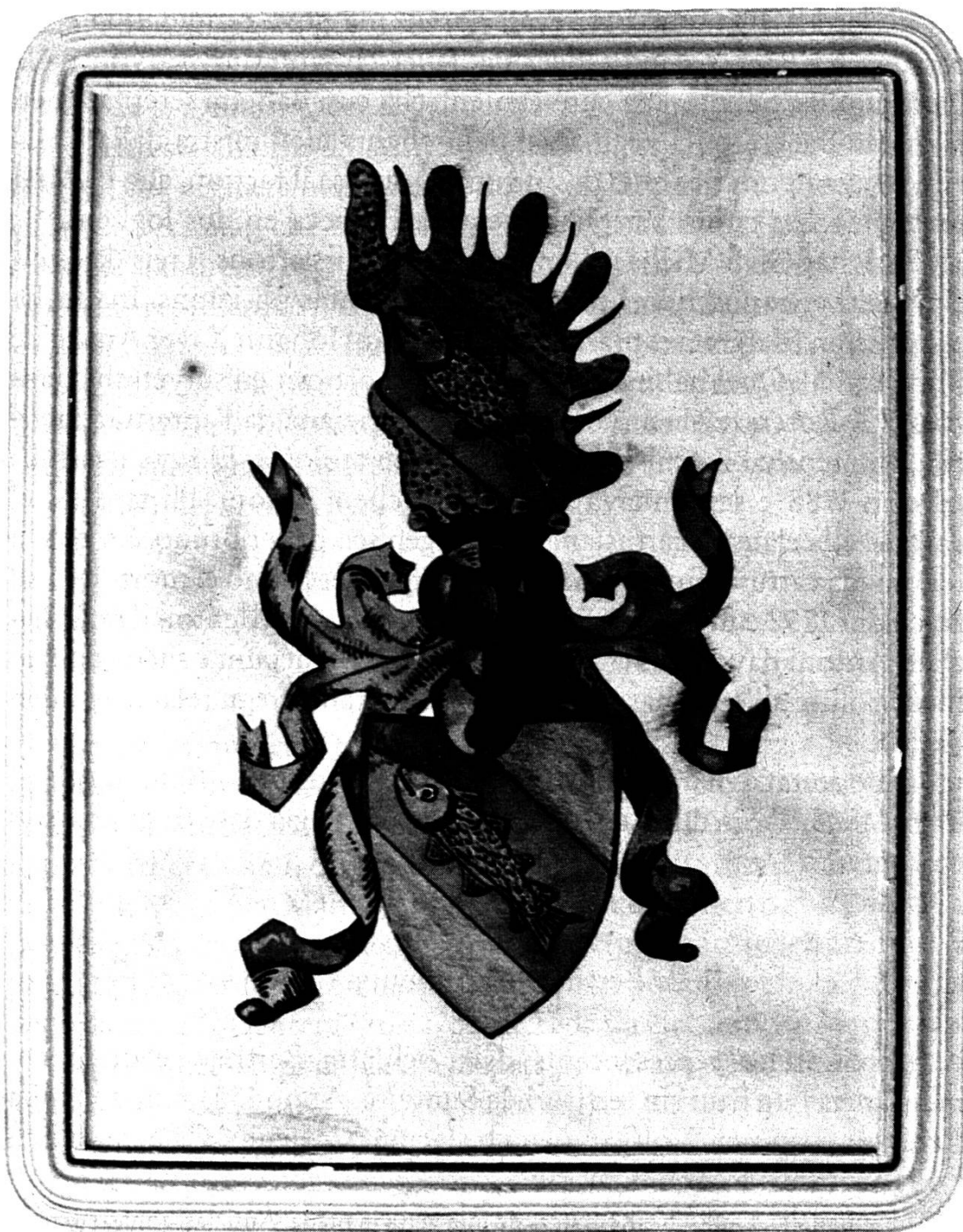
maletg 1 Arma Lombris, lingia da Sumvitg Sin funs d'azur in flum verd cun pesch argentau. Sin la capellina encoronada in'ala (sgol) blaua cun la figura dil scut. Reproducziun d'in maletg en possess dils frars Lombris a Sumvitg.