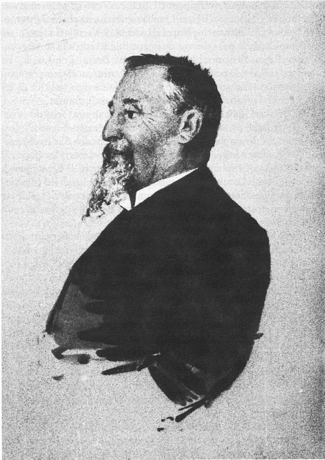
Mistral Bruno de Lombris * 1830-1908