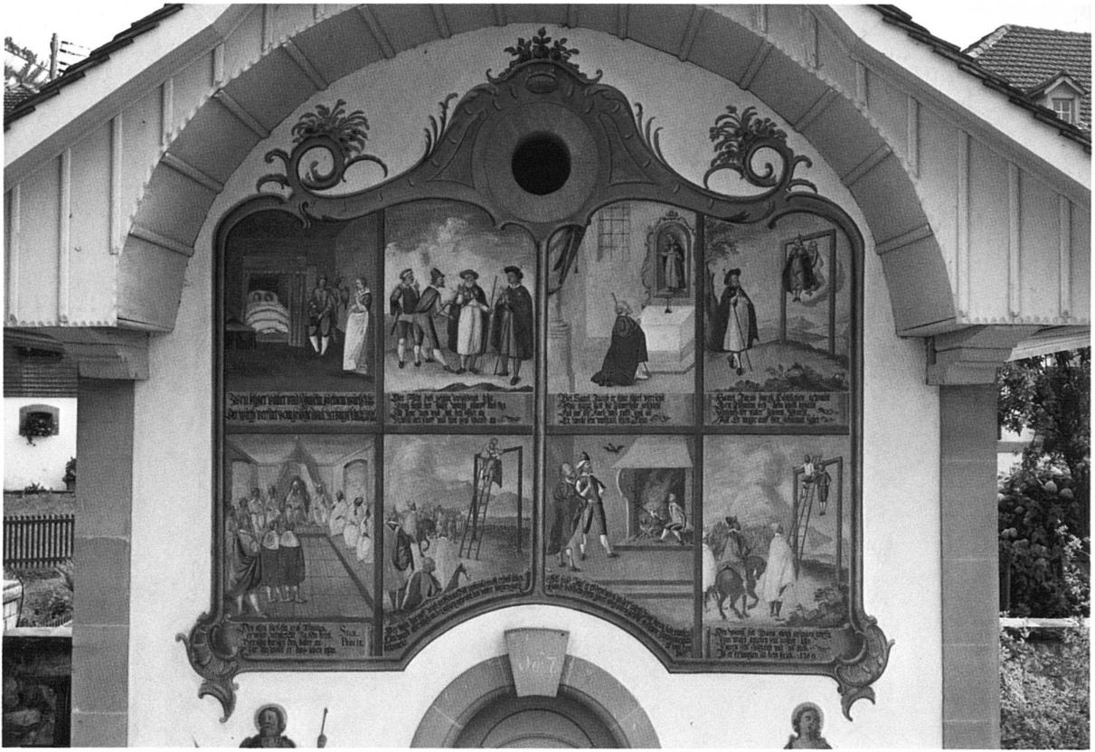
Fresco vid la fatschada dalla caplutta da Tafers/Friburg cun la legenda da s. Giachen en maletgs e text tudestg