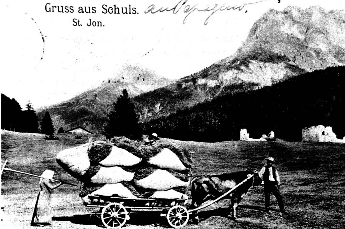
Il bain da San Jon intuorn il 1900