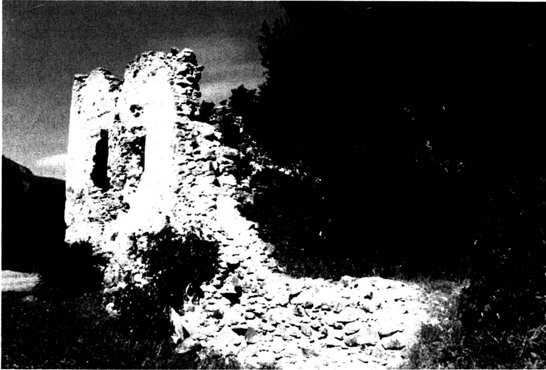
Restanzas da la baselgia medioevala