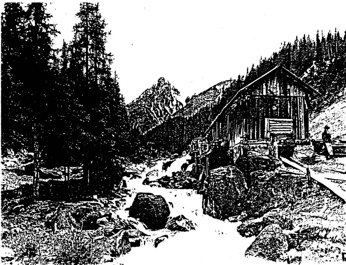
La resgia da Plauna cun l'auadottel