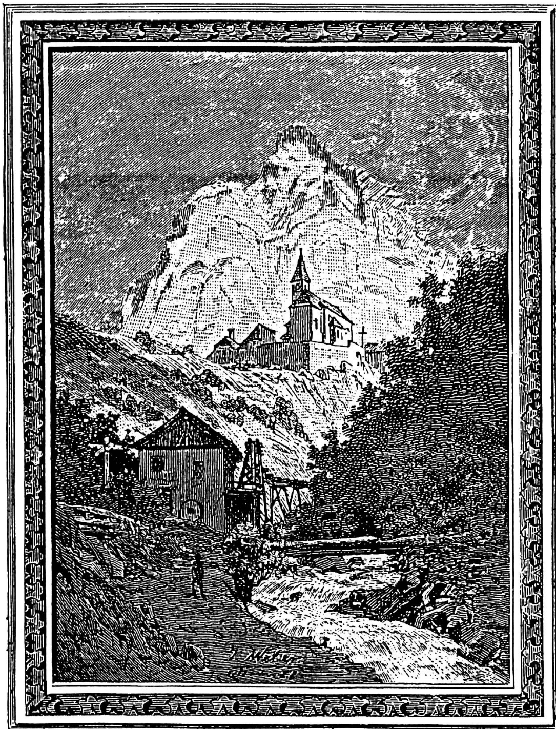
Il vegl muglin dal chastè