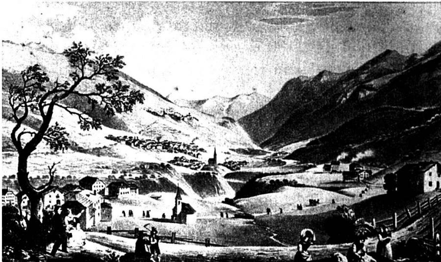
Gravüra da Vulpera Dadaint e Dadoura, intuorn il 1830

Las gabellas cumpressivas da Gulpera Suot sun: 151 \frac{1}{4} «March Käs» = 453 \frac{3}{4} noudas da chaschöl e 17 mozza üerdi. Feudatari es Luzi Giamara 16 . Probabelmaing cha quel es nat dal 1670 sco figl da Ludwig Giamara e Chatrina Rauner.